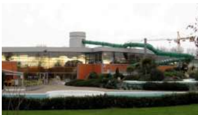
ESPACE NAUTIQUE JEAN VAUCHÈRE